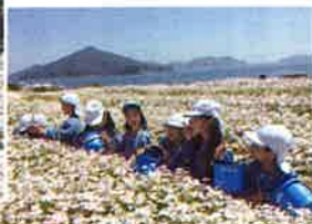
どれにしようかな