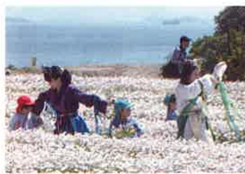
おどひめさんといっしょだよ!