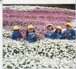
ピンク♡のマーガレットかわいいね in フラワーパーク浦島 <5月9日幼保園児花摘みイベント>