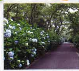
今年も見事な紫陽花が! 見ごろは7月中旬ごろまでです in 紫雲出山