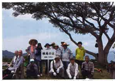
▲志々島の最高点、横尾の辻を整備しました

6月11日には町内外のボランティア、部会員約50名と島民の方々と清掃活動を行いました。作業の後には茶がゆのお接待をいただいたり、島の方が整備されたあじさい畑を案内していただきながら、交流を深めました。