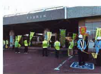
▲交通安全キャンペーン

住民の皆様の被害が少しでも軽減されるよう、今後も防災・減災の啓発活動に取り組んでまいります。