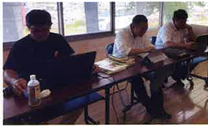
▲詫間町に関する多くの文献から探すのも一苦労

インターネットの百科事典であるウィキペディアで詫間町を検索した際、情報量が乏しかったため、2年前より詫間町に伝わる浦島太郎伝説についての情報を収集し、加筆しています。