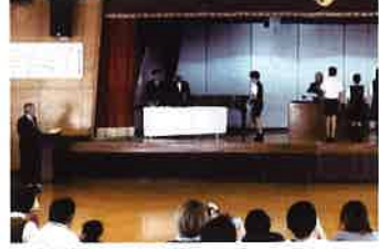
▲防災標語の表彰式