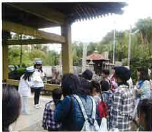
▲前回の子どもガイドの様子

今年度は瀬戸内国際芸術祭秋会期で粟島が会場になるため、来島者に「芸術だけでなく粟島の魅力」を伝えようと、市内小学生がガイドとして島を案内する「子どもガイド」を養成しています。5回の講座で島の人から話を聞いたり、粟島滞在作家さんとのワークショップや島巡りを行い、島の魅力を自分の言葉で伝えられるガイドを目指します。