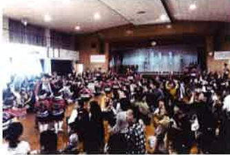
▲幼年消防団の防災パレード