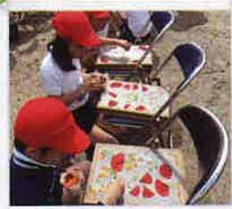
お花を摘んで自分だけの花和紙作り in フラワーパーク浦島 <4月小学生花和紙体験>