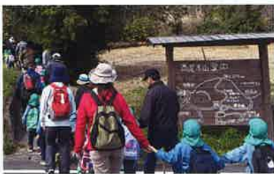
▲県道沿いの登山口からスタート!

今年も詫間保育所の子どもたちと、桜の咲く季節に二度、高尾木山に登りました。事前に登山道を地元の皆さんと草刈りや伐木、ロープの張り直しを行い、安全確認を行いました。