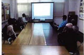
▲防災・減災プレゼンテーション