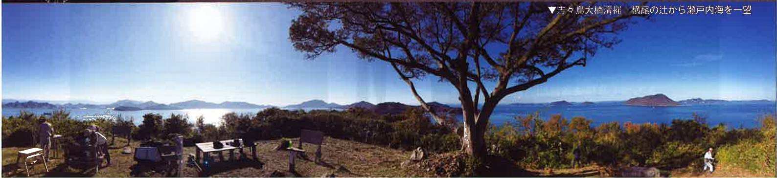
▼志々島大楠清掃 横尾の辻から瀬戸内海を一望