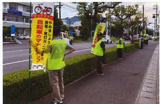
▲交通安全キャンペーン