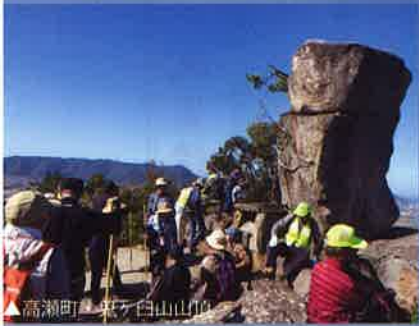
▲高瀬町・鬼ヶ白山登山