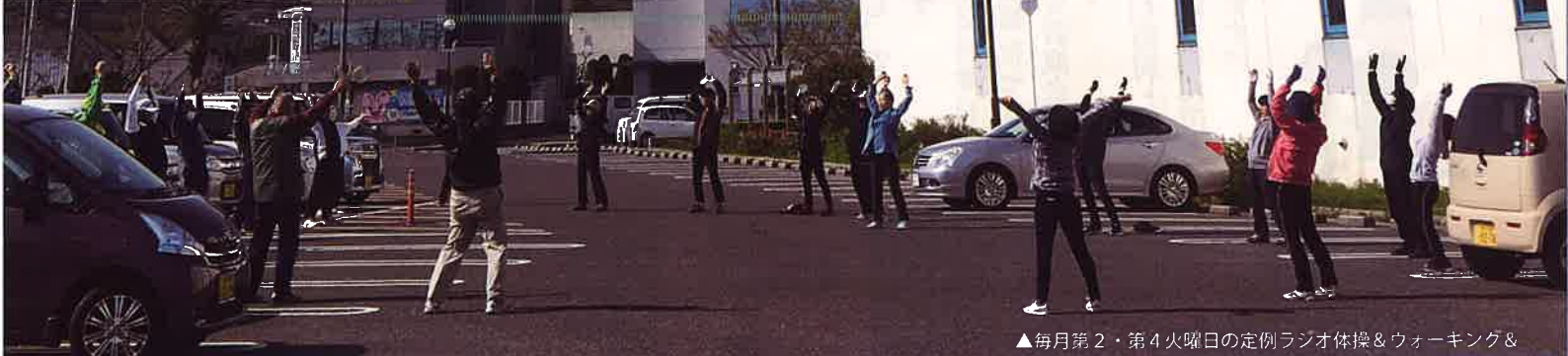
▲毎月第2・第4火曜日の定例ラジオ体操&ウォーキング&