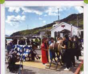
粟島太鼓&獅子舞ワークショップ助成 瀬戸芸のオープニングとクロージング にてお披露目しました！