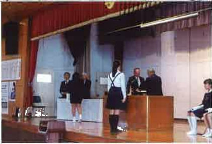
▲防災・減災標語 表彰式