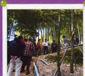
地域づくり団体全国研修交流会 兵庫県大会参加 < 11月9日から11日11日 >