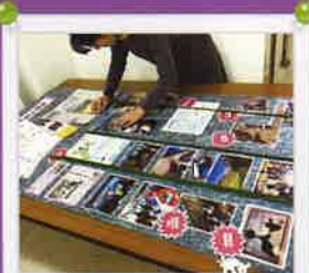
詫間町文化祭にて、まちづくり活動 報告パネル作成、展示しました。 < 11月9日10日 >