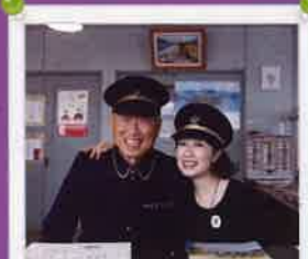
瀬戸内国際芸術祭 2019 秋会期中、 瀬流郵便局をまちづくりのボランティ アの皆さんの協力で開局しました。