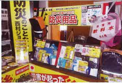
▲家具転倒防止器具の展示