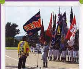
今年も熱戦！歌式野球・バレー・剣道 浦島太郎旗争奪少年スポーツ大会 < 8月17日18日 >