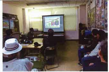
▲防災プレゼンテーション