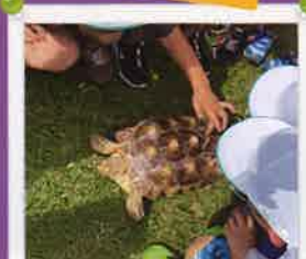
箱浦ビジターハウスの館長トワです。 1年前は1.5キロでした。1年で何キロ になったでしょう？答えは下に★