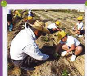
キレイなマーガレットの花を咲かせてね。 in フラワーパーク浦島 < 10月下旬小学生花植え体験 >