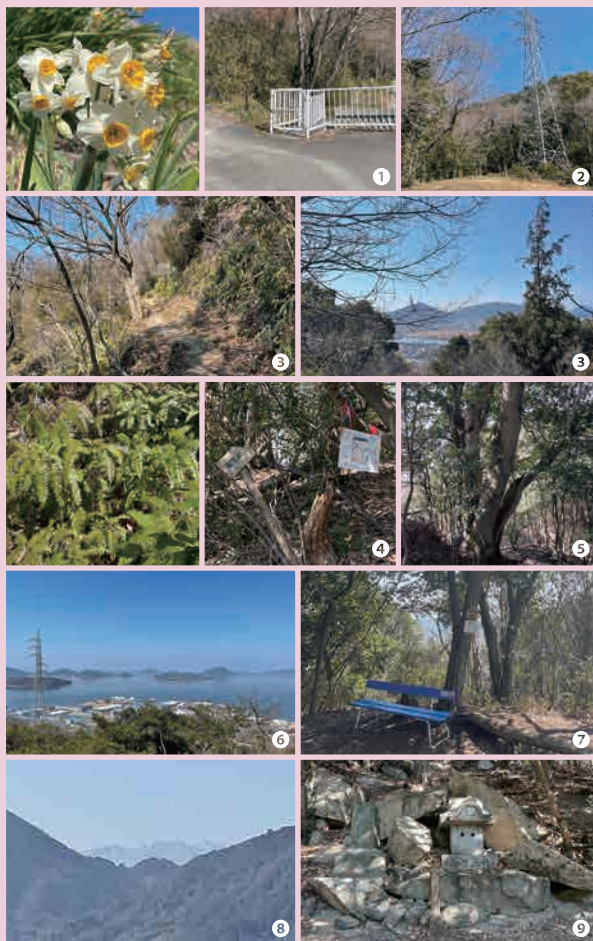
頂上手前の絶景POINTは運が良ければ愛媛県の赤星山⑧も見えるかも。

頂上より南へ10m以上、下がったところに石造りの龍王社⑨があり、以前はよく地域の人がお参りをしていました。雨が降らない時は、地域の人が頂上で火を燃やし、雨ごいをしていました。昔は、秋にマツタケやシメジ、イグチなどのキノコ狩りも楽しめたそうです。分岐より鉄塔を目指して、尾根伝いに歩くとハゲ山に到着。工業団地や多度津、丸亀、坂出の工業団地、瀬戸大橋を含む多くの島々を望むことができます。地域の小学生の遠足の目的地でもあります。